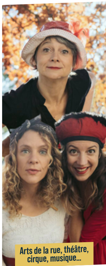
Arts de la rue, théâtre, cirque, musique...