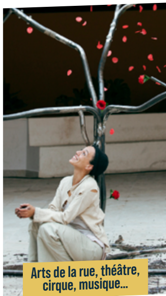
Arts de la rue, théâtre, cirque, musique...